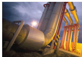
Nachhaltige Energie- und Versorgungswirtschaft