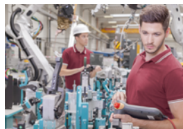
Produktion und Digitale Transformation